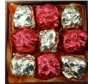
Boite 9 Rochers