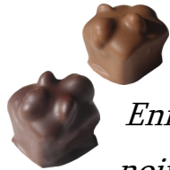
Enrobage noir ou lait