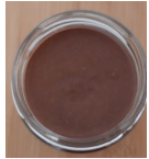
Pate à tartiner